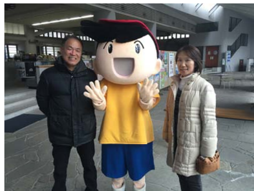
直島町長ご夫妻とすなおくん