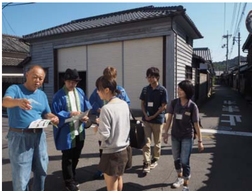
ロゲイニング風景