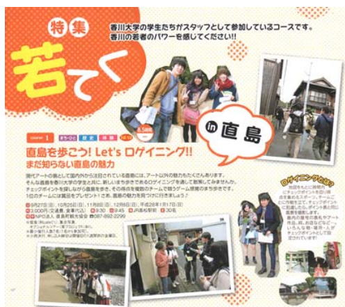
てくてくさぬき 掲載ページ