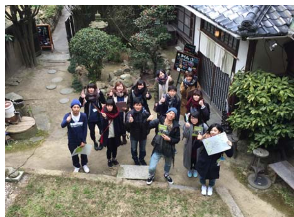
ロゲイニング風景 スタート時